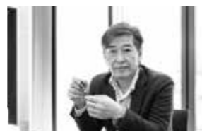
設計デザイナーの関口社長

「ZEST会」とはZENSYU-HOUSEの家づくりに携わる職人集団のことで、高い品質を保つために設立。同社スタッフと綿密なミーティングを重ね、より良い施工を行う。