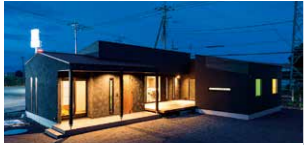
一切の妥協をせずにデザインした心地よい空間は、家づくりの参考になるはず