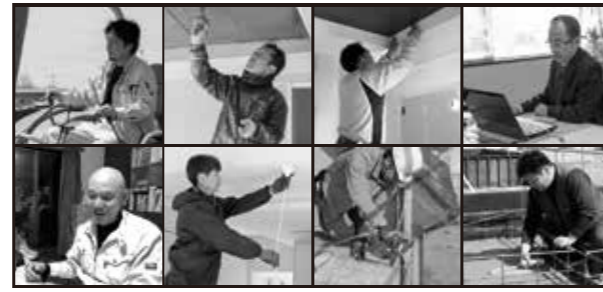
家づくりやアフターを支える職人たち「ZEST会」